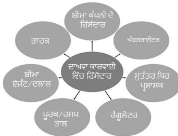
Diagram 1: ਦਾਅਵਾ ਕਾਰਵਾਈ ਵਿੱਚ ਹਿੱਸੇਦਾਰ

ਵਿਅਕਤੀ ਨੂੰ ਦਾਅਵੇ ਕਿਵੇਂ ਨਿਪਟਾਏ ਜਾਂਦੇ ਹਨ ਨੂੰ ਵਿਚਾਰਨ ਤੋਂ ਪਹਿਲਾਂ ਦਾਅਵਿਆਂ ਦੀ ਕਾਰਵਾਈ ਵਿੱਚ ਹਿੱਤ ਰੱਖਣ ਵਾਲੀਆਂ ਧਿਰਾਂ ਨੂੰ ਸਮਝਣਾ ਚਾਹੀਦਾ ਹੈ।